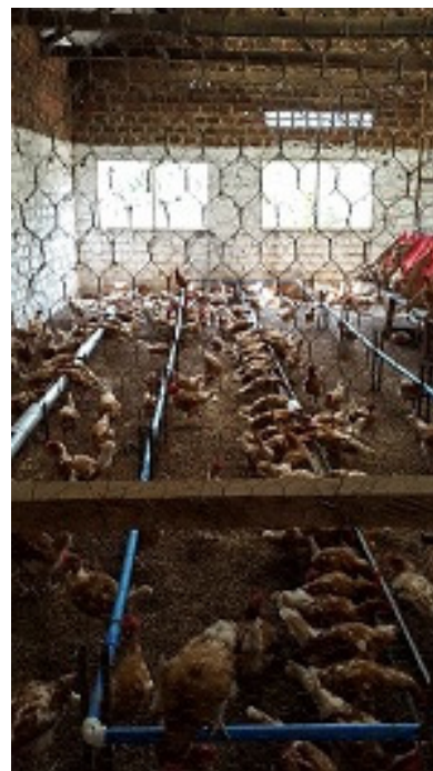
Figuur 1 ruimte voor kippen

Aan de andere kant moet er veelvuldig overlegd worden. Dit varieerde van brainstormsessies over de toekomst van de