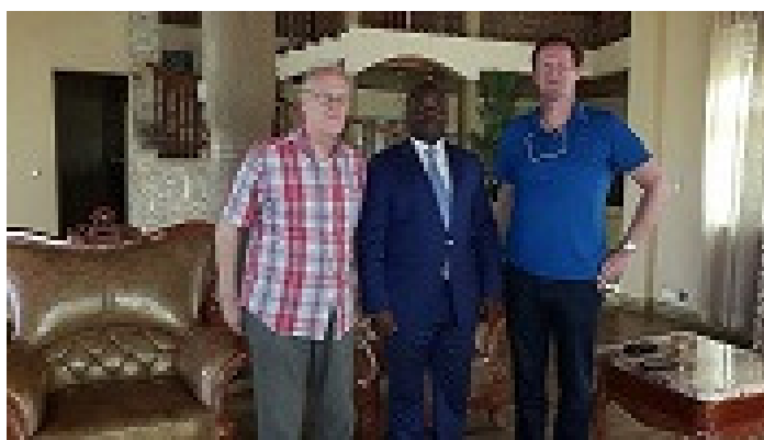
Figuur 5 Op bezoek bij de minister voor water

toezegging dat zij willen meewerken om het project te ondersteunen. Zo is toegezegd dat we de FloFlo zonder import belasting mogen importeren en dat we bij volgende bezoeken niet meer hoeven te betalen voor ons