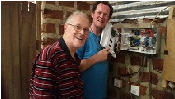
Figuur 2 de installatie aangepast

De nadruk in de eerste week ligt met name op het klussen op de boerderij en de eerste discussies over de toekomst van de boerderij.