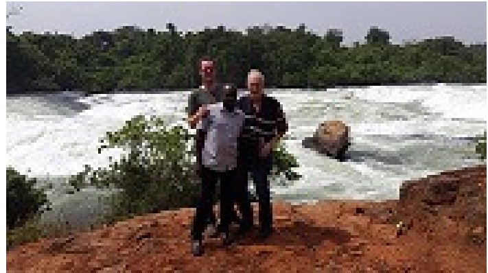
Figuur 4 Watervallen van de Nijl

hebben we ook de watervallen bezocht. Tijdens deze tocht samen met Abbey en Godfrey hebben we weer een aantal discussies gehad. Zo is besloten Mozes, een van de vrijwilligers die sinds enkele maanden op de boerderij woont, hij is door